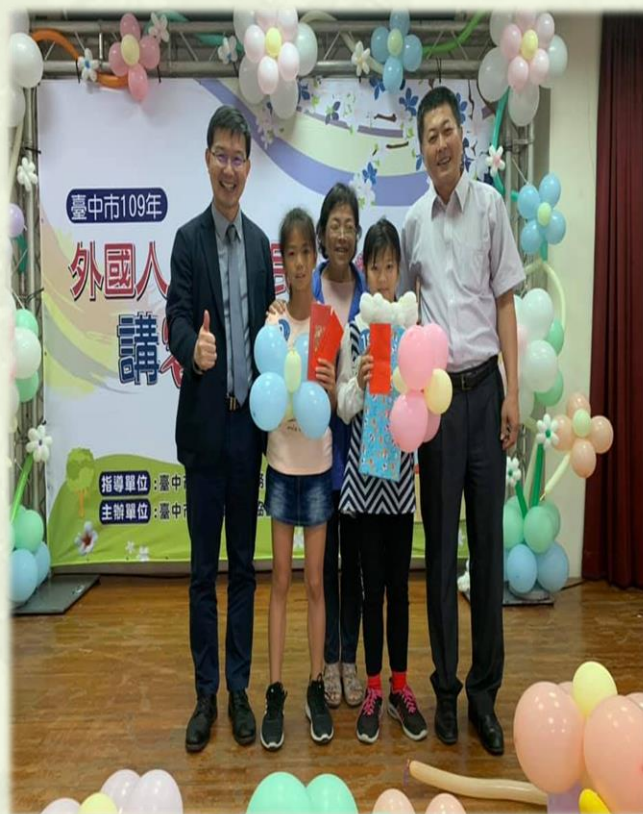
新住民說客語比賽